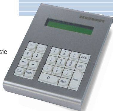
Option: unité de commande pour MultiPrinter 785 et MultiPrinter 787 (semblables)

75 Rue Paul et Marc Barbezat Z.I. Ouest la Soie 69150 Décines Tel : 04 78 49 06 08 Fax : 04 78 49 88 99